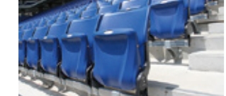
観客用のシートははいたって普通でした。とはいえ、万博競技場には背もたれがなかったから大進化といってもいいかもね。

再認識。 パケット感はないからドリフト向きではないだろうけど、助手席用とかでぜひ作ってほしいです！ どうしてBRIDEになったのかを聞いたところ、驚いたことに、寄付やスポンサーではなく、依頼を受けて納入したそうです。PRのためではなく、性能を認められたのがうれしいじゃないですか！ 「何社かとやりとりしたようですけど、最終的にウチに決まって感激です」と広報の笹尾さん。なんか試作品を作り、いまの形状になったそうです。関係者にBRIDE好きがいたんでしょうね！ このベンチって、日本じゃめずらしい2列なんです。前列が12脚、後列が10脚。おかげでベンチがすごく豪華に