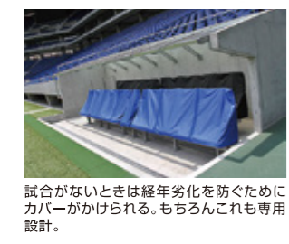
試合がないときは経年劣化を防ぐためにカバーがかけられる。もちろんこれも専用設計。