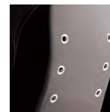
HISTRIXのバックスタイル

¥167,000 (税別) ●難燃生地 ●日本製 ●重量:約6.5kg (参考数値)