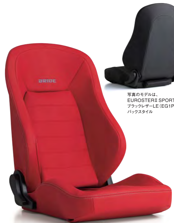
写真のモデルは、 EUROSTER II SPORTE- ブラックレザーLE (EG1PAF) の バックスタイル

¥157,000 (税別) ●パイプフレーム ●プロテインレザー™ ●難燃生地 ●日本製 ●重量:約12.5kg (参考数値)