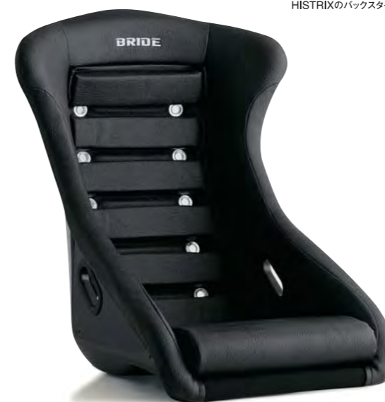
写真のモデルは、HISTRIX (F51ARR) です。