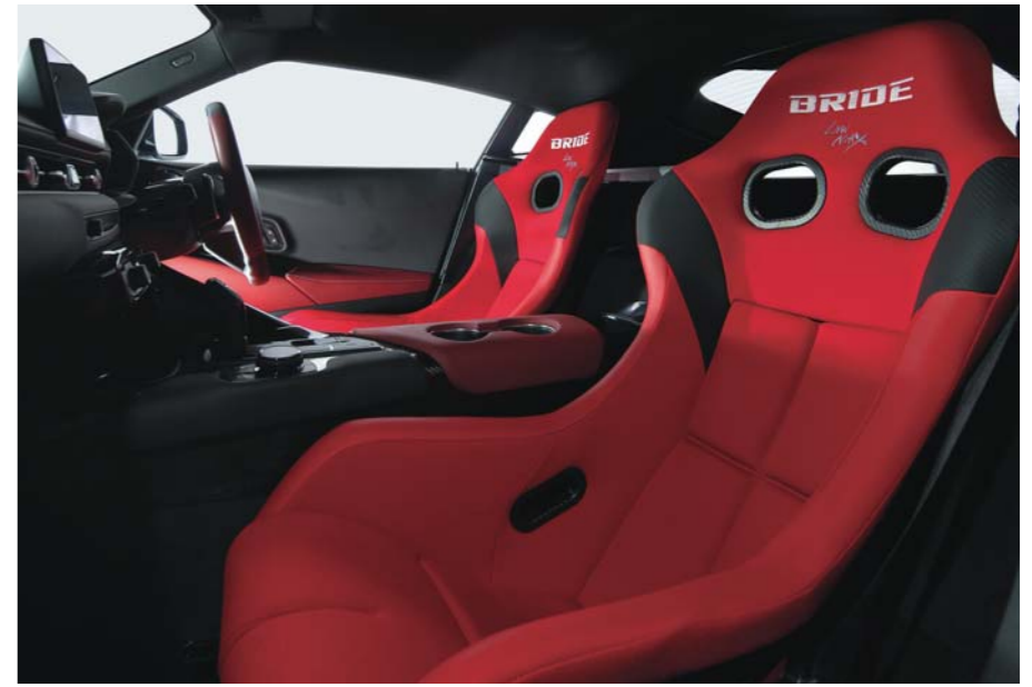
写真は、トヨタ・スープラの運転席、助手席ともにZETA IV・FRP製シルバースhell・レッド(HA1BMF)を装着したものです。