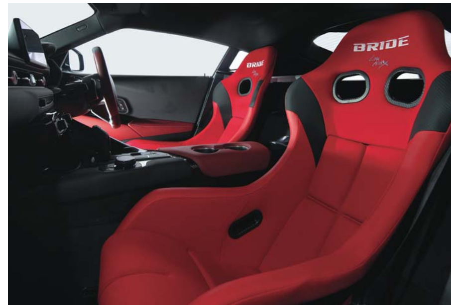
写真は、トヨタ・スープラの運転席、助手席ともにZETA IV・FRP製シルバースhell・レッド(HA1BMF)を装着したものです。