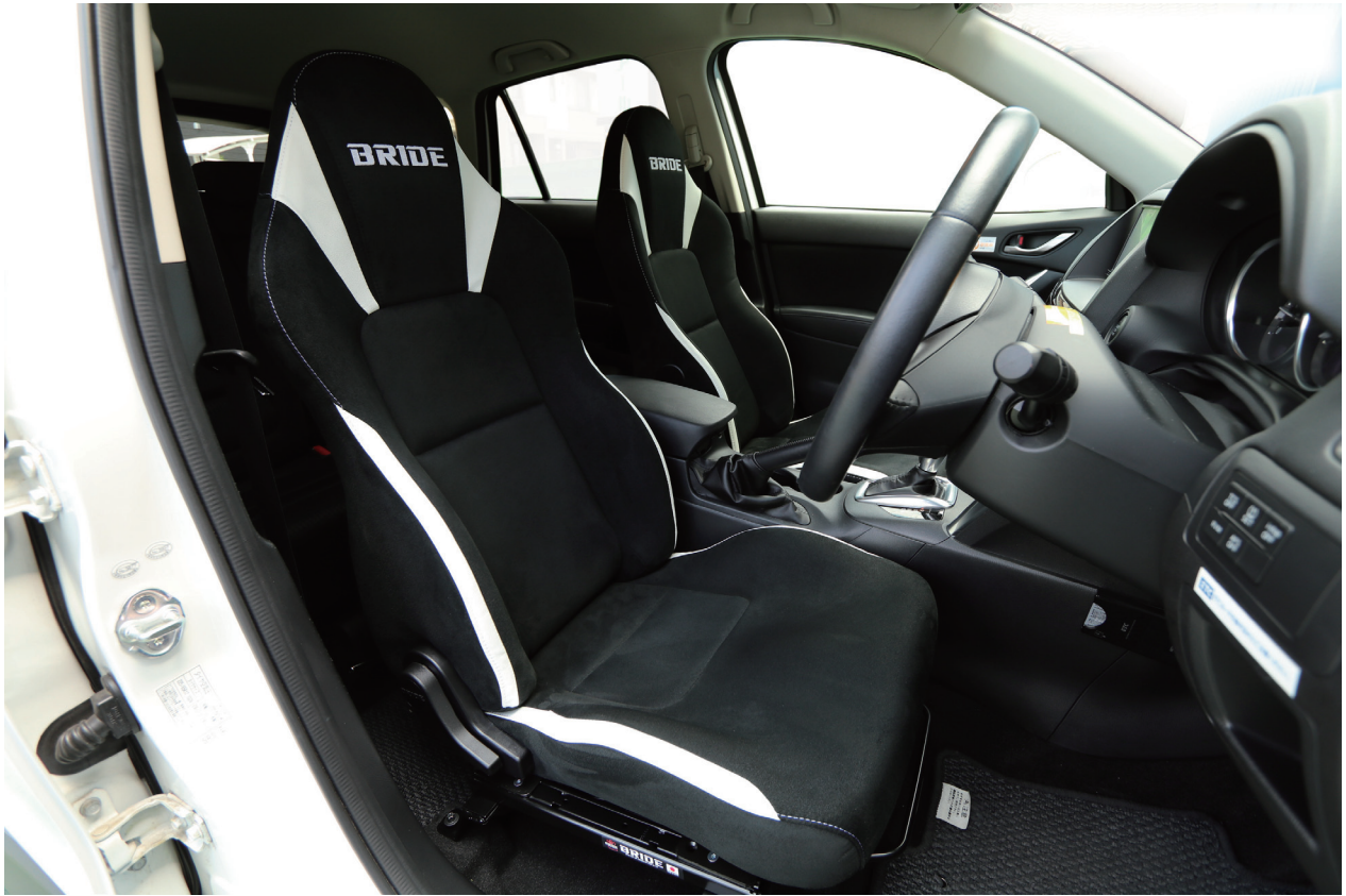
STREAMS Orca-white FMM01 × MAZDA CX-5 装着例