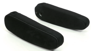
別売アームレスト