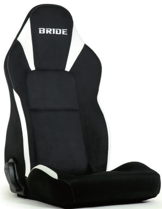
STREAMS Orca-white FMM01