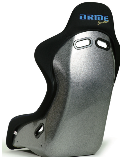
ZETA III Kanou-blue HMK02