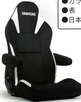
STREAMS CRUZ Orca-white FMM01 (別売アームレスト対応モデル)