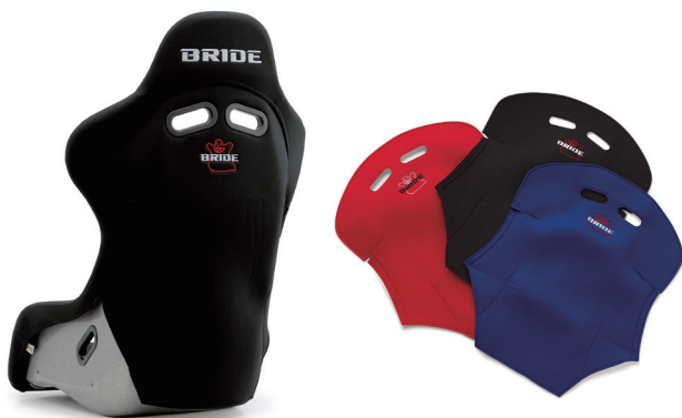
シートバックプロテクター(別売)

本製品を後部座席のある車両に装着する場合、後部座席の乗員保護のため、別売のシートバックプロテクターの装着が必要です。