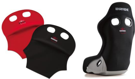
シートバックプロテクター（別売）

本製品を後部座席のある車両に装着する場合、後部座席の乗員保護のため、別売のシートバックプロテクターの装着が必要です。