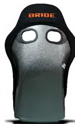
背面デザイン (HMK04 PLUS)