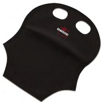
シートバックプロテクター（別売）

本製品を後部座席のある車両に装着する場合、後部座席の乗員保護のため、別売のシートバックプロテクターの装着が必要です。