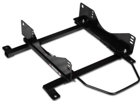
スーパーシートレール LFタイプ トヨタ ヤリス 右席用

発売日：2021年2月1日 商品名：スーパーシートレール LFタイプ トヨタ ヤリス 右席用 品番：T407LF 価格：22,000円（本体：20,000円） JAN：4560459233818