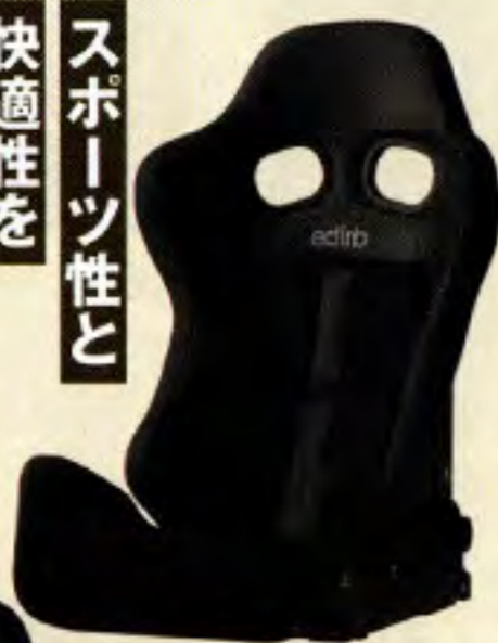
BRIDE edirb 161 価格：32万4500円 (5月1日発売)

「161」は『GIAS III』を、「0A1」は『ZETA IV』をベースにして、元々の素養は高速G対応の本格派。ともにロゴとステッチは写真のグレーのほか、レッドパターンも選ぶことができる。その他、『STRADIA III』をベースにする「172 (31万3500円)」、ZIEG IVをベースとする「0B1 (23万1000円)」も5月1日に発売を開始する。