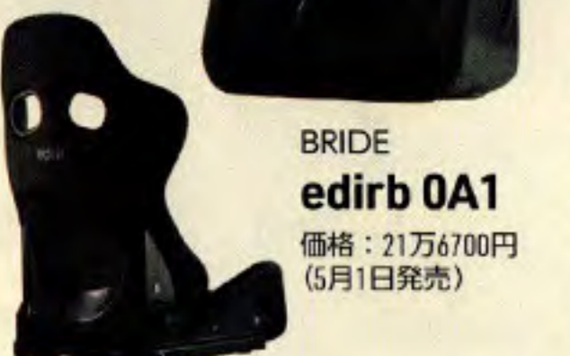
BRIDE edirb 0A1 価格：21万6700円 (5月1日発売)

「161」は『GIAS III』を、「0A1」は『ZETA IV』をベースにして、元々の素養は高速G対応の本格派。ともにロゴとステッチは写真のグレーのほか、レッドパターンも選ぶことができる。その他、『STRADIA III』をベースにする「172 (31万3500円)」、ZIEG IVをベースとする「0B1 (23万1000円)」も5月1日に発売を開始する。