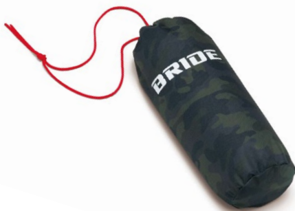
専用の収納袋付き