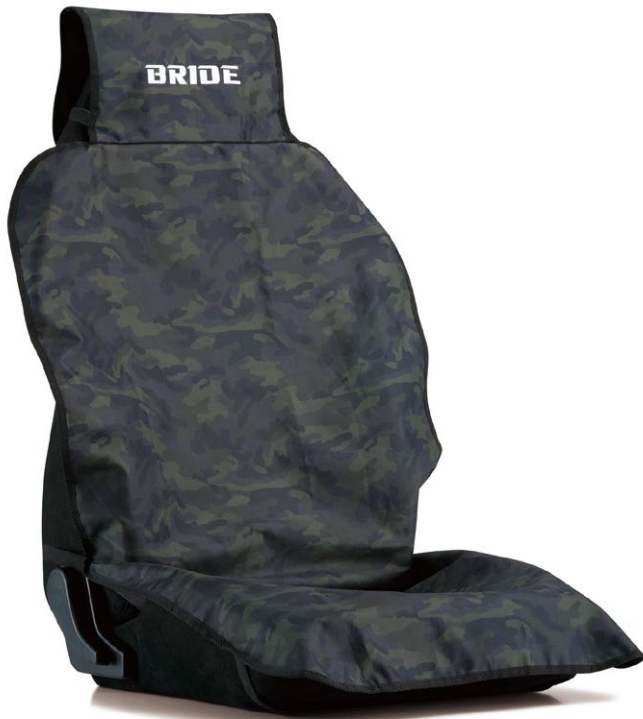
グリーンカモフラージュ