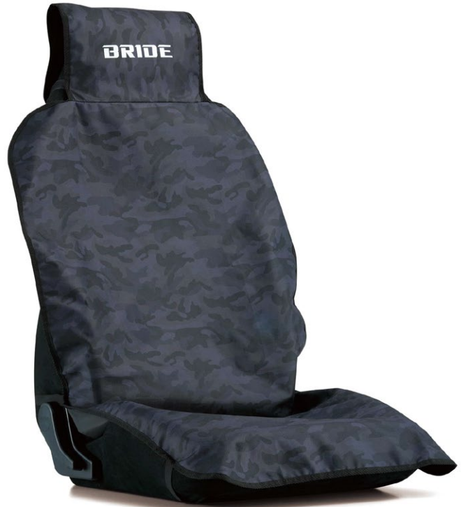
ブルーカモフラージュ