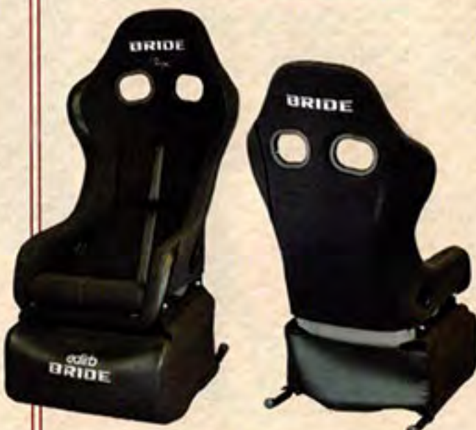
ブラック&ブラック