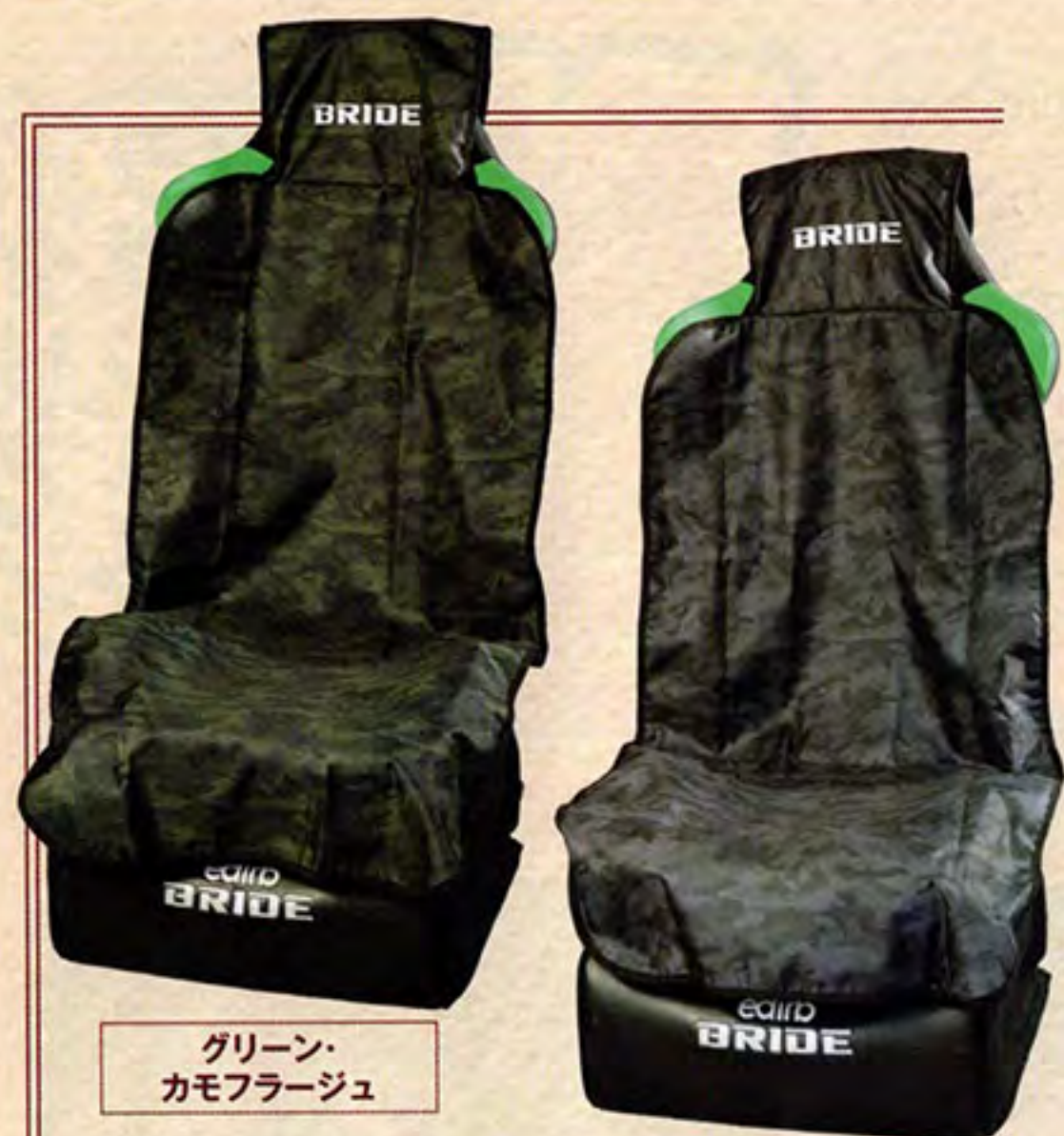
グリーン・カモフラージュ