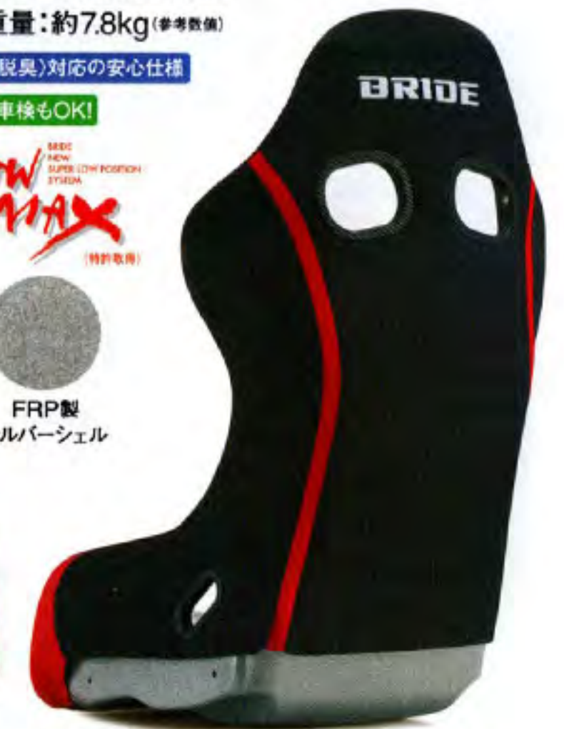
写真のモデルは、ZETA IV REIMS・FRP製シルバーシェル・ブラック&レッド(HA1BNF)です。