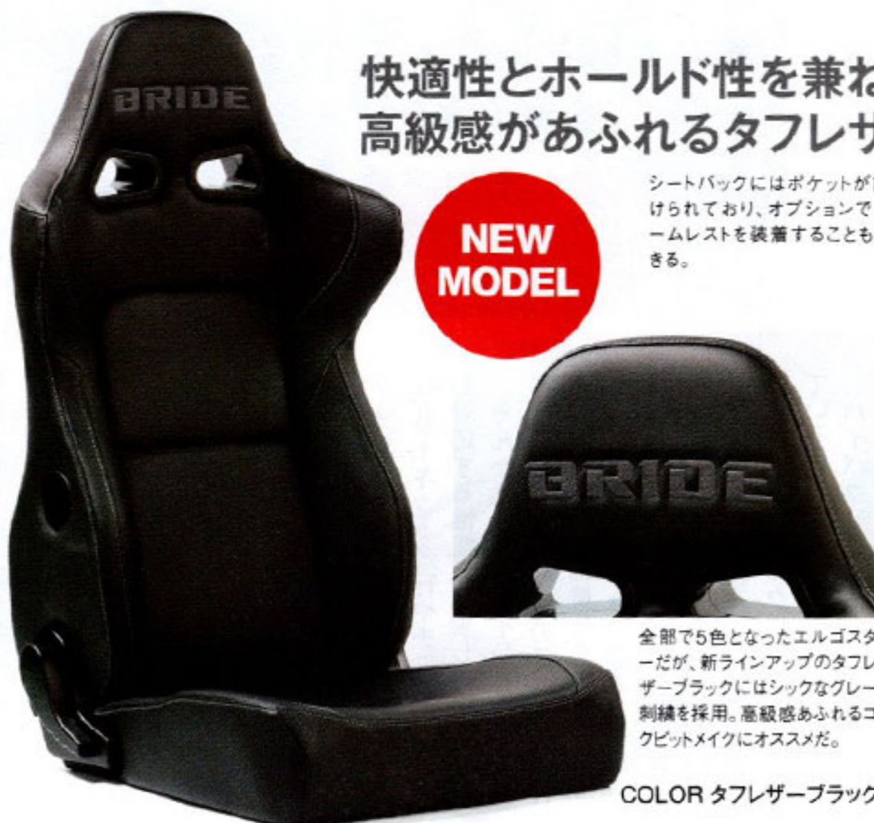
COLOR タフレザーブラック

今回追加されたタフレザーブラックはPVCレザー生地、高級感あるルックスと肌触り、さらに高い耐久性を兼ね備えていることが特徴。お手入れも簡単というのも嬉しい。