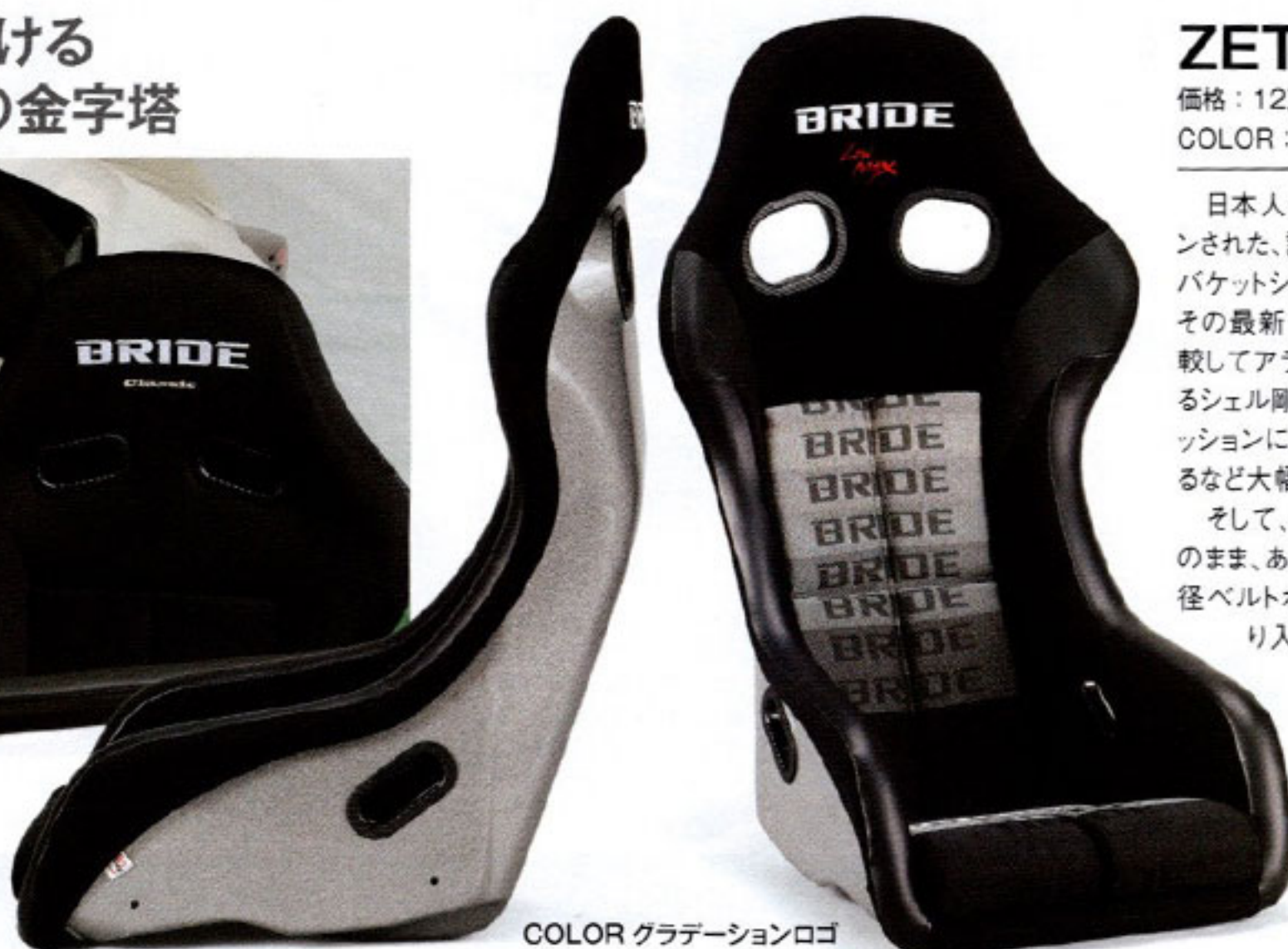
COLOR グラデーションロゴ

ジータ4をベースとした派生モデルとしては写真の"クラシック"だけでなく、小柄なドライバー向けに各部をチューニングした"ヴェリア"、スエード調表皮をまとった"レイムス"などが存在。ブリッドではユーザーからの意見を採り入れつつ、常に新しいモデルの開発を行っているのだ。