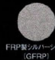
FRP製シルバーシェル (GFRP)