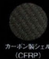
カーボン製シェル (CFRP)

BRIDE LOW MAX LOW POSITION SYSTEM (特許取得)