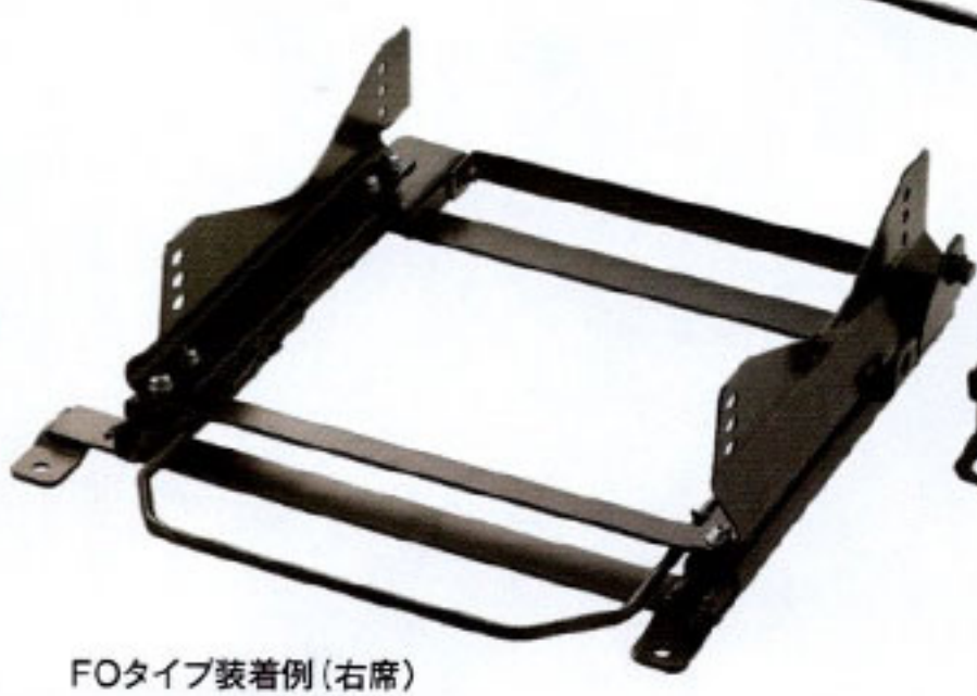
FOタイプ装着例(右席)