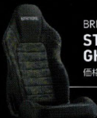
BRIDE STREAMS GHOST 価格：15万2900円～17万1600円