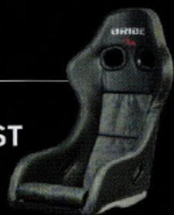
BRIDE ZETAGHOST 価格：16万1700円