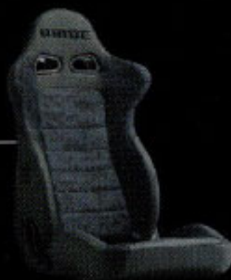
BRIDE EURO GHOST 価格：15万2900円～17万1600円