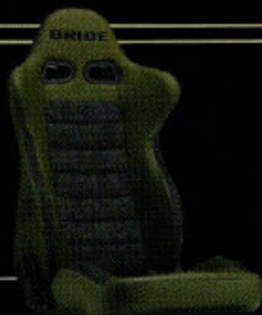
BRIDE EUROGHOST X 価格：15万円2900円～17万1600円