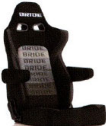
写真のモデルは、ERGOSTER・グラデーションロゴBE(E64GSN)+別売アームレスト・ブラックBE (右用:P51AAN、左用:P52AAN)です。