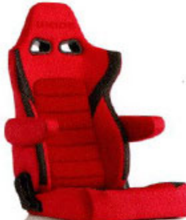
写真のモデルは、ERGOSTER・レッドBE(E64BSN)+別売アームレスト・レッドBE (右用:P51BBN、左用:P52BBN)です。