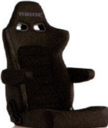
写真のモデルは、ERGOSTER・チャコールグレーBE(E64KSN)+別売アームレスト・チャコールグレーBE (右用:P51KKN、左用:P52KKN)です。