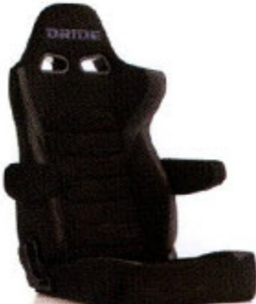
写真のモデルは、ERGOSTER・ブラックBE(E64ASN)+別売アームレスト・ブラックBE (右用:P51AAN、左用:P52AAN)です。