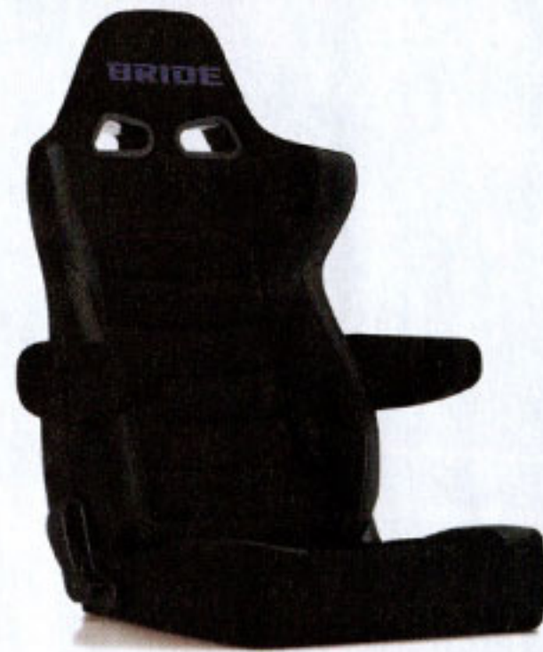
写真のモデルは、ERGOSTER・ブラックBE(E64ASN) +別売アームレスト・ブラックBE (右用:P51AAN、左用:P52AAN)です。