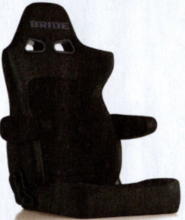
写真のモデルは、ERGOSTER・チャコールグレーBE(E64KSN) +別売アームレスト・チャコールグレーBE (右用:P51KKN、左用:P52KKN)です。