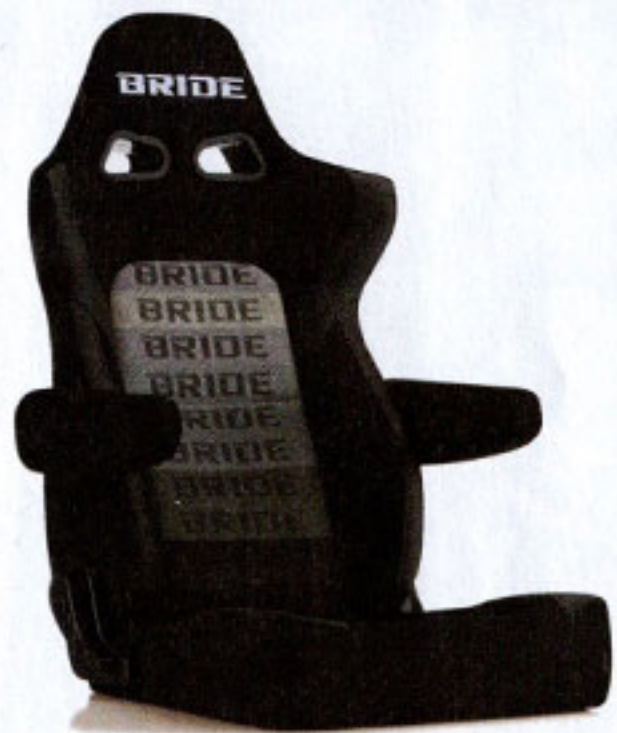
写真のモデルは、ERGOSTER・グラデーションロゴBE(E64GSN) +別売アームレスト・ブラックBE (右用:P51AAN、左用:P52AAN)です。