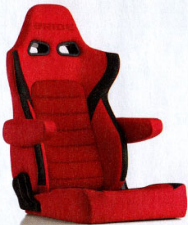
写真のモデルは、ERGOSTER・レッドBE(E64BSN) +別売アームレスト・レッドBE (右用:P51BBN、左用:P52BBN)です。