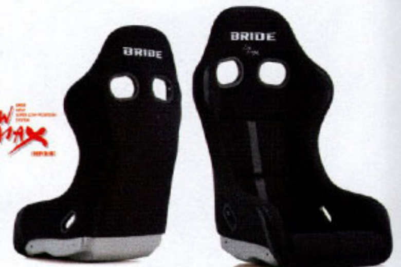
ZETA IV REIMS BLACK & BLACK

写真のモデルは、ZETA IV REIMS・ FRP製シルバーシェル・ ブラック&ブルー (HA1CNF)です。