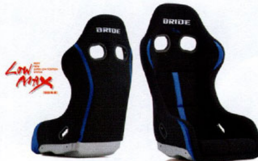
ZETA IV REIMS BLACK & BLUE

写真のモデルは、ZETA IV REIMS・ FRP製シルバーシェル・ ブラック&レッド (HA1BNF)です。