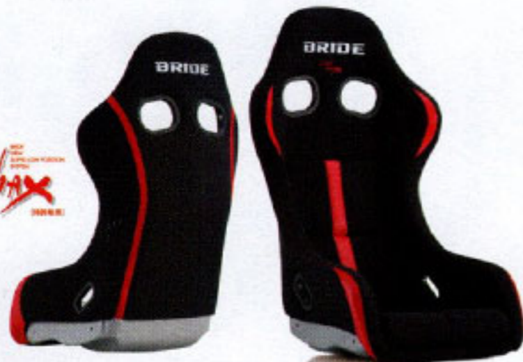
ZETA IV REIMS BLACK & RED

写真のモデルは、ZETA IV REIMS・ FRP製シルバーシェル・ ブラック&レッド (HA1BNF)です。