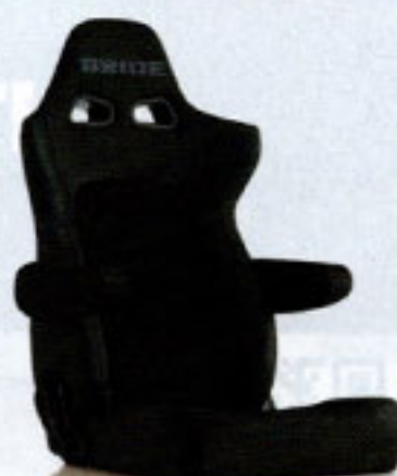
写真のモデルは、ERGOSTER・チャコールグレーBE(E64KSN)+別売アームレスト・チャコールグレーBE(右用:P51KKN、左用:P52KKN)です。