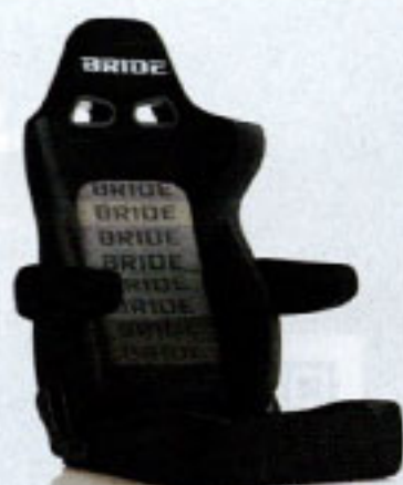
写真のモデルは、ERGOSTER・グラデーションロゴBE(E64GSN)+別売アームレスト・ブラックBE(右用:P51AAN、左用:P52AAN)です。