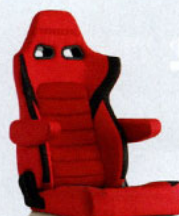
写真のモデルは、ERGOSTER・レッドBE(E64BSN)+別売アームレスト・レッドBE(右用:P51BNN、左用:P52BNN)です。