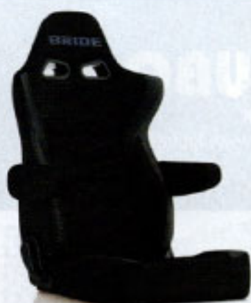
写真のモデルは、ERGOSTER・ブラックBE(E64ASN)+別売アームレスト・ブラックBE(右用:P51AAN、左用:P52AAN)です。