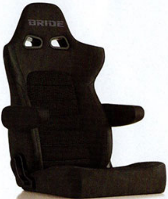
写真のモデルは、ERGOSTER・チャコールグレーBE(E64KSN)+別売アームレスト・チャコールグレーBE(右用:P51KKN、左用:P52KKN)です。