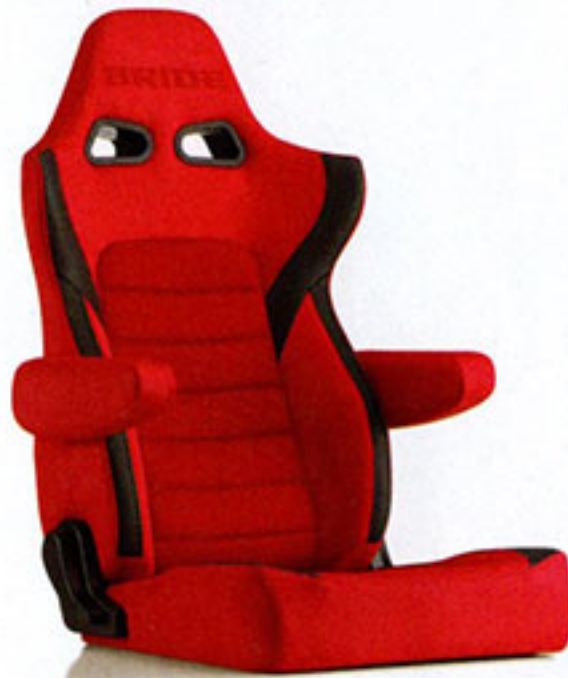
写真のモデルは、ERGOSTER・レッドBE(E64BSN)+別売アームレスト・レッドBE(右用:P51BBN、左用:P52BBN)です。