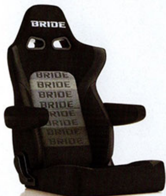
写真のモデルは、ERGOSTER・グラデーションロゴBE(E64GSN)+別売アームレスト・ブラックBE(右用:P51AAN、左用:P52AAN)です。