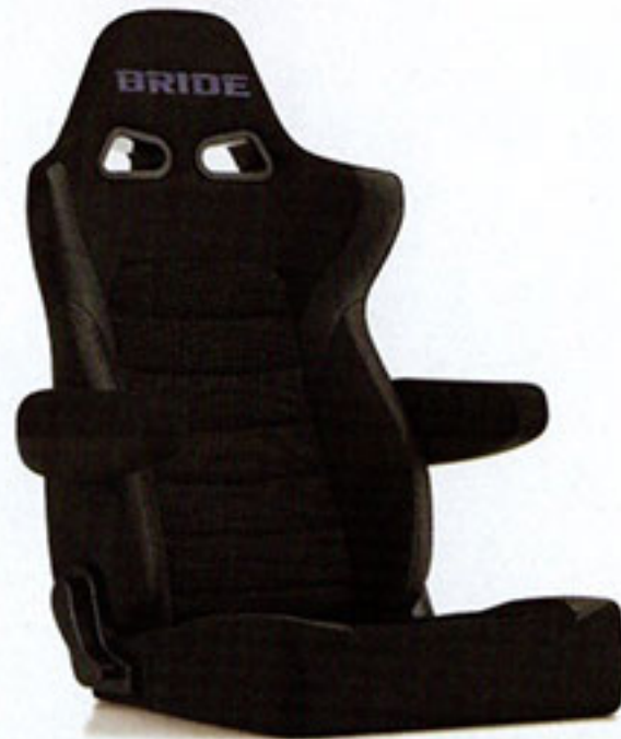
写真のモデルは、ERGOSTER・ブラックBE(E64ASN)+別売アームレスト・ブラックBE(右用:P51AAN、左用:P52AAN)です。