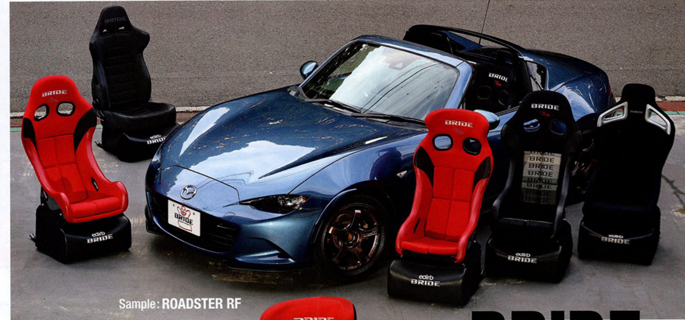
Sample: ROADSTER RF