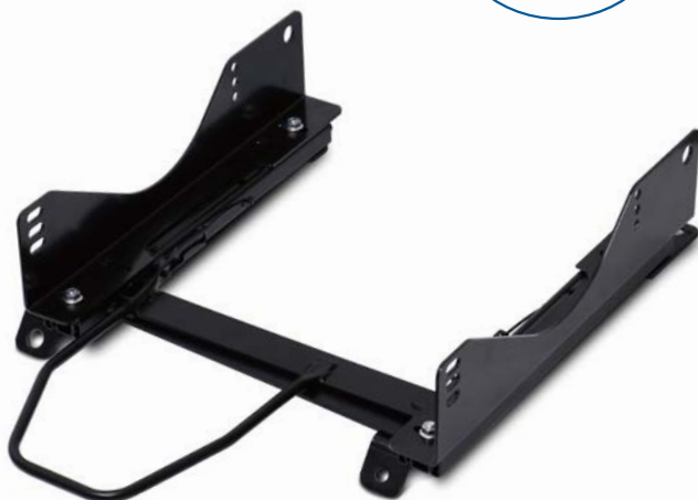
スーパーシートレール LFタイプ・RA05LF