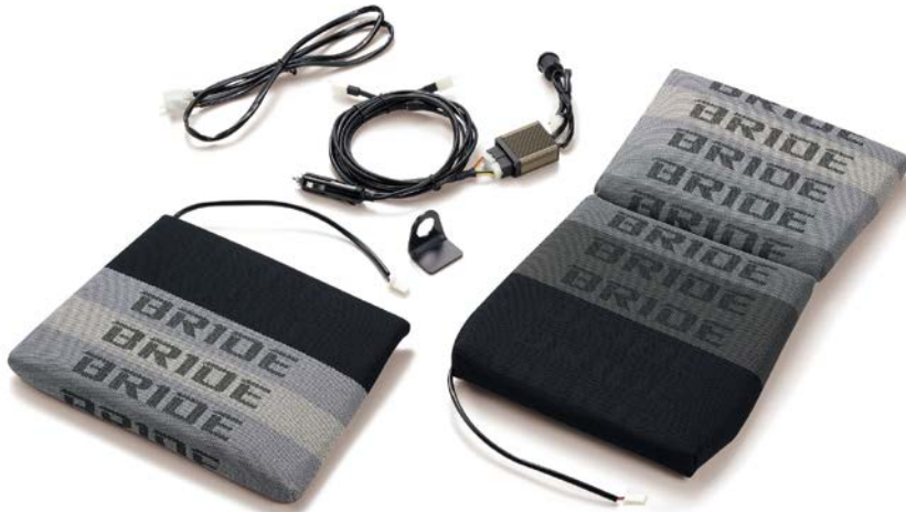
シートヒーター内蔵クッション(グラデーションロゴ)