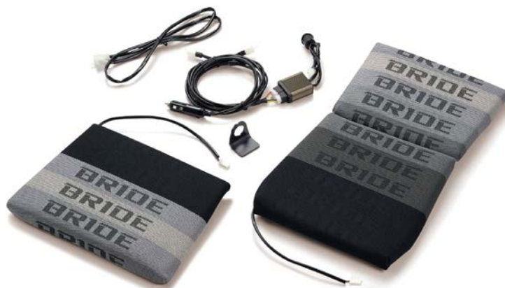
シートヒーター内蔵クッション(グラデーションロゴ)

本製品は、全国のBRIDEマイスターショップをはじめ、BRIDE取扱店でご注文いただけます。