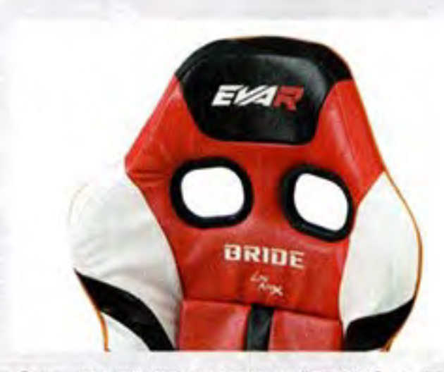
●ヘッドレストのエリアには "EVAR" のロコ そしてベルトホールの下にBRIDEロゴを配置 プレミアム感もあふれるルックスが魅力だ