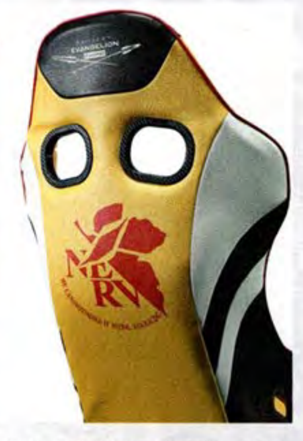
●シート背面にもロゴを配置。背面カ バーが後席乗員の保護を担うので別売 りのシートバックプロテクターも不要。 デザインを存分に楽しめる