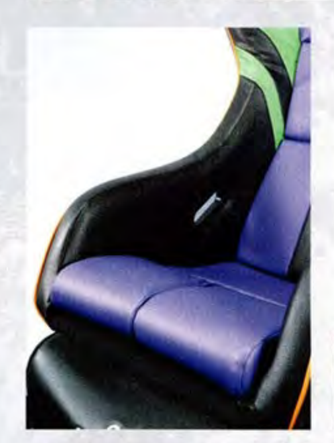
●腿部クッションは先端を左右に分割 させたデザイン。ペダル操作もスムー ズにできるうえ、ロングドライブでの 疲労軽減にも効果的だ