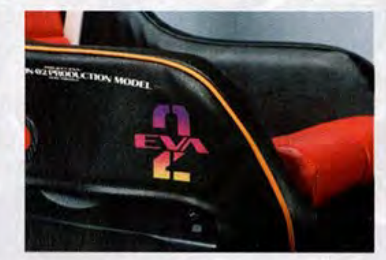
●ニーサポートの側部には"機体ナンバー"が 配される。また乗降時に擦れやすい角にはパイ ビングを配置しデザインと実用性を両立