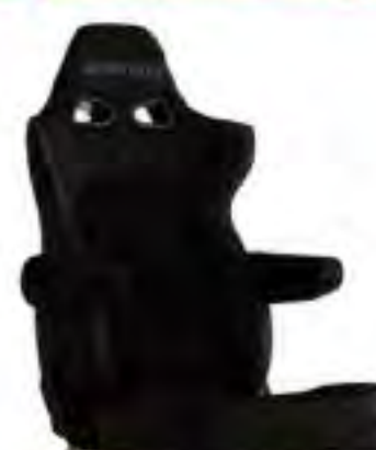
写真のモデルは、ERGOSTER・ チャコールグレーBE(E64KSN)+ 別売アームレスト・チャコールグレーBE (右用:P51KKN、左用:P52KKN)です。