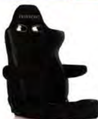
写真のモデルは、ERGOSTER・ ブラックBE(E64ASN)+ 別売アームレスト・ブラックBE (右用:P51AAN、左用:P52AAN)です。