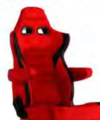
写真のモデルは、ERGOSTER・ レッドBE(E64BSN)+ 別売アームレスト・レッドBE (右用:P51BBN、左用:P52BBN)です。