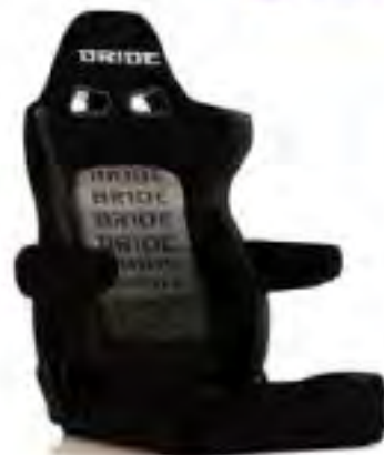
写真のモデルは、ERGOSTER・ グラデーションロゴBE(E64GSN)+ 別売アームレスト・ブラックBE (右用:P51AAN、左用:P52AAN)です。

BRIDE®は、ブリッド株式会社の登録商標です。 〒476-0015 愛知県東海市東海町1丁目11番1号 TEL.(052)689-2611 FAX.(052)689-2612 ※掲載製品の仕様・デザイン・価格等の変更及び、販売終了を 予告なく行う場合がありますので、予めご了承ください。