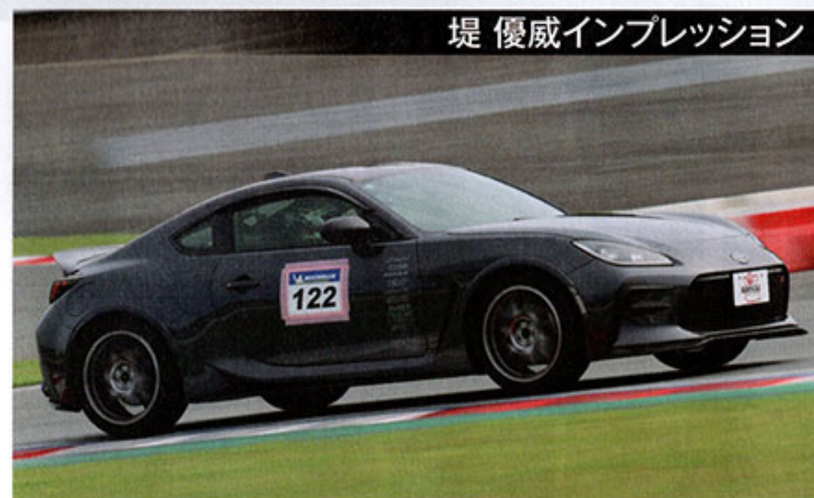
堤 優威インプレッション

10月1日から受注。デリバリーも始まっている。高級スウェード調生地、フルカバータイプの表皮、カラーラインのアクセントが特徴で、ファッション性や上質感を重んじたモデル。ガイアスIIIがベースとあって、フルバケット並みのホールド性と剛性の高さを誇る。リクライニングデバイスはバックラッシュが極めて少ない。