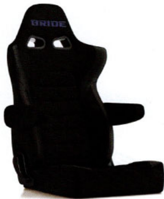
写真のモデルは、ERGOSTER・ ブラックBE(E64ASN)+別売アームレスト・ブラックBE (右用:P51AAN、左用:P52AAN)です。