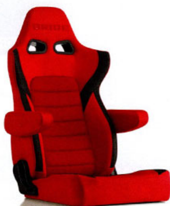
写真のモデルは、ERGOSTER・ レッドBE(E64BSN)+別売アームレスト・ レッドBE (右用:P51BBN、左用:P52BBN)です。