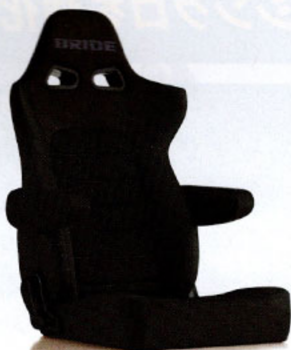
写真のモデルは、ERGOSTER・ チャコールグレーBE(E64KSN)+別売アームレスト・ チャコールグレーBE (右用:P51KKN、左用:P52KKN)です。