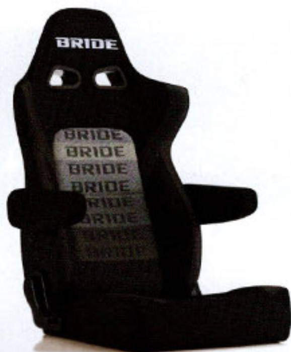
写真のモデルは、ERGOSTER・ グラデーションロゴBE(E64GSN)+別売アームレスト・ブラックBE (右用:P51AAN、左用:P52AAN)です。