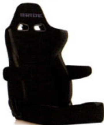
写真のモデルは、ERGOSTER・ブラックBE(E64ASN)+別売アームレスト・ブラックBE(右用:P51AAN、左用:P52AAN)です。