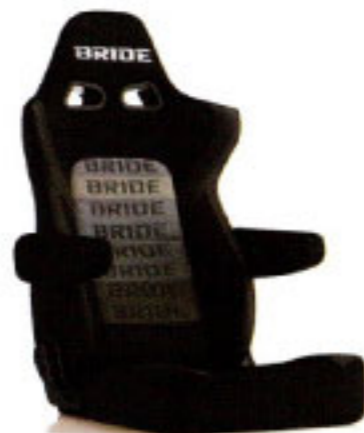
写真のモデルは、ERGOSTER・グラデーションロゴBE(E64GSN)+別売アームレスト・ブラックBE(右用:P51AAN、左用:P52AAN)です。