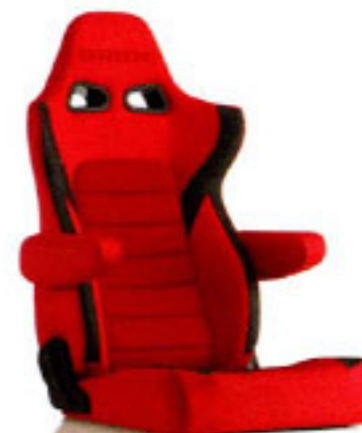
写真のモデルは、ERGOSTER・レッドBE(E64BSN)+別売アームレスト・レッドBE(右用:P51BBN、左用:P52BBN)です。