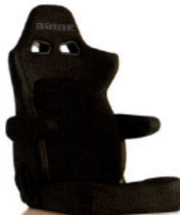
写真のモデルは、ERGOSTER・チャコールグレーBE(E64KSN)+別売アームレスト・チャコールグレーBE(右用:P51KKN、左用:P52KKN)です。