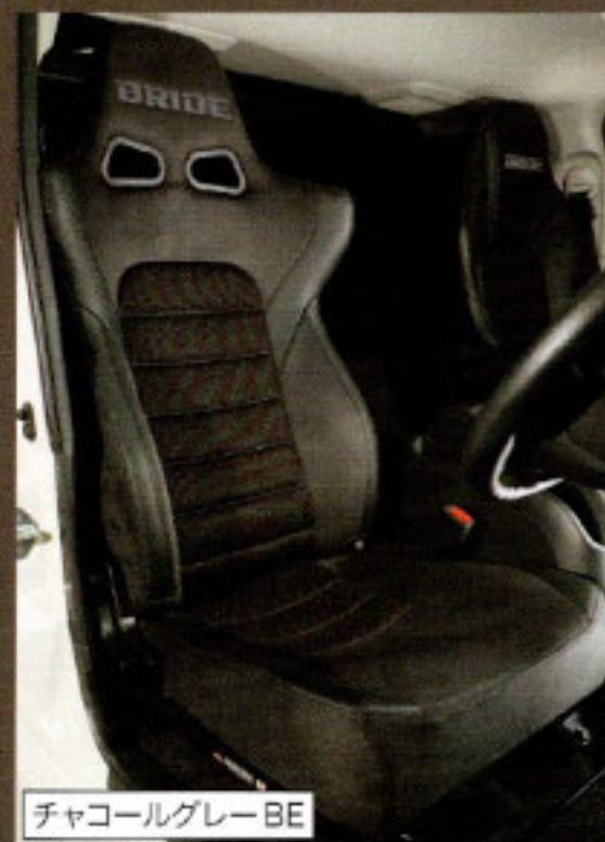
チャコールグレー BE