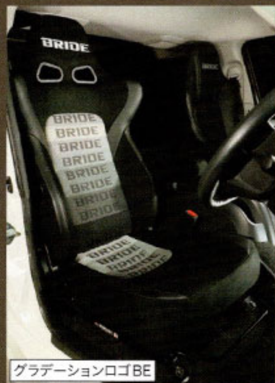
グラデーションロゴ BE