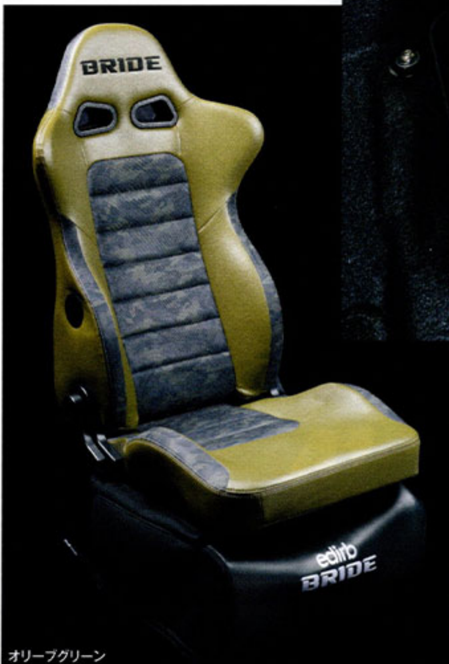
オリーブグリーン