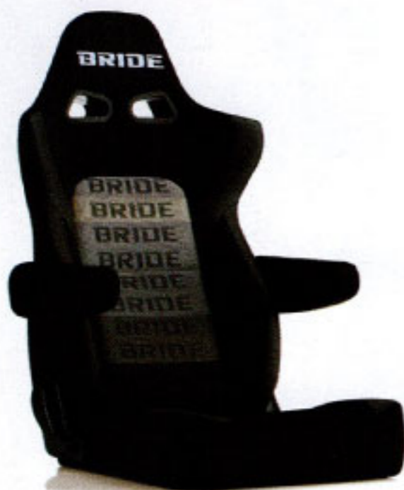
写真のモデルは、ERGOSTER・ グラデーションロゴBE(E64GSN)+別売アームレスト・ブラックBE (右用:P51AAN、左用:P52AAN)です。