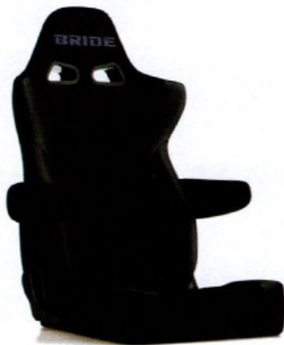
写真のモデルは、ERGOSTER・ ブラックBE(E64ASN)+別売アームレスト・ブラックBE (右用:P51AAN、左用:P52AAN)です。