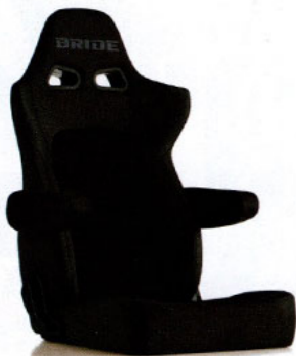
写真のモデルは、ERGOSTER・ チャコールグレーBE(E64KSN)+別売アームレスト・ チャコールグレーBE (右用:P51KKN、左用:P52KKN)です。