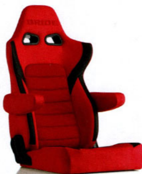
写真のモデルは、ERGOSTER・ レッドBE(E64BSN)+別売アームレスト・ レッドBE (右用:P51BBN、左用:P52BBN)です。