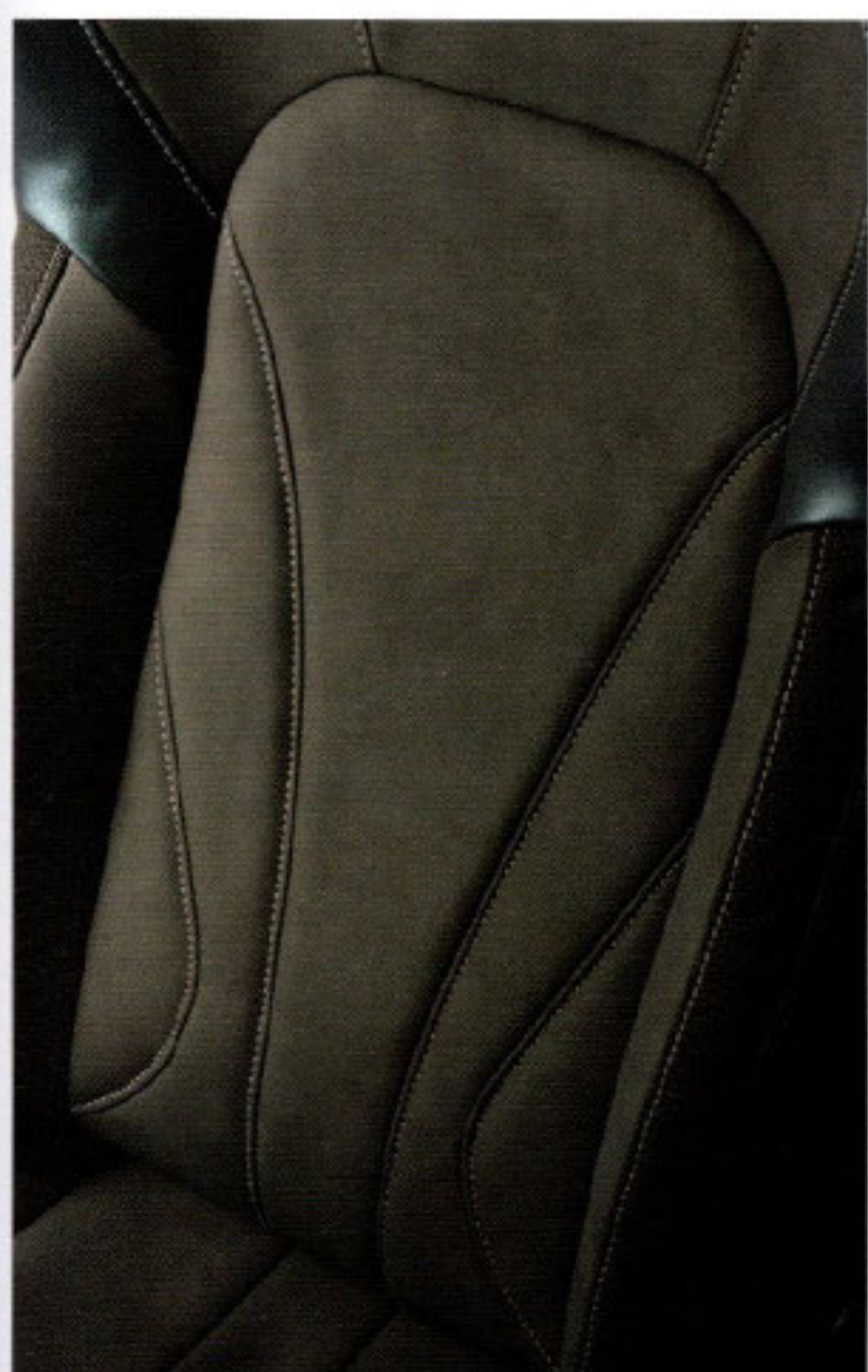
ヌバックのような風合いをPVCレザーで引き出した「ヌグレ生地」。スタイリッシュさ溢る新縫製のステッチラインも要チェックだ