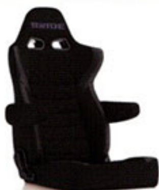
写真のモデルは、ERGOSTER・ブラックBE(E64ASN)+別売アームレスト・ブラックBE(右用:P51AAN、左用:P52AAN)です。