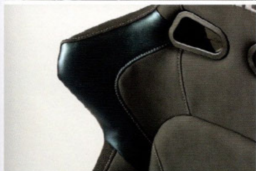
ブリッドの刺繍ロゴで高級感を高めるヘッドレストには新縫製のステッチライン、ショルダーサポートはスポーティなエッジが一層際立つマジョーラ生地が与えられている