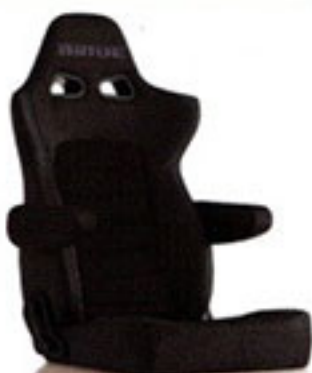
写真のモデルは、ERGOSTER・チャコールグレーBE(E64KSN)+別売アームレスト・チャコールグレーBE(右用:P51KKN、左用:P52KKN)です。