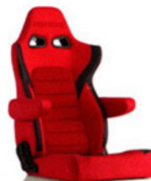
写真のモデルは、ERGOSTER・レッドBE(E64BSN)+別売アームレスト・レッドBE(右用:P51BBN、左用:P52BBN)です。