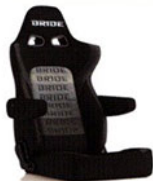
写真のモデルは、ERGOSTER・グラデーションロゴBE(E64GSN)+別売アームレスト・ブラックBE(右用:P51AAN、左用:P52AAN)です。

BRIDE®は、ブリッド株式会社の登録商標です。 〒476-0015 愛知県東海市東海町1丁目11番1号 TEL.(052)689-2611 FAX.(052)689-2612 ※掲載製品の仕様・デザイン・価格等の変更及び、販売終了を予告なく行う場合がありますので、予めご了承ください。