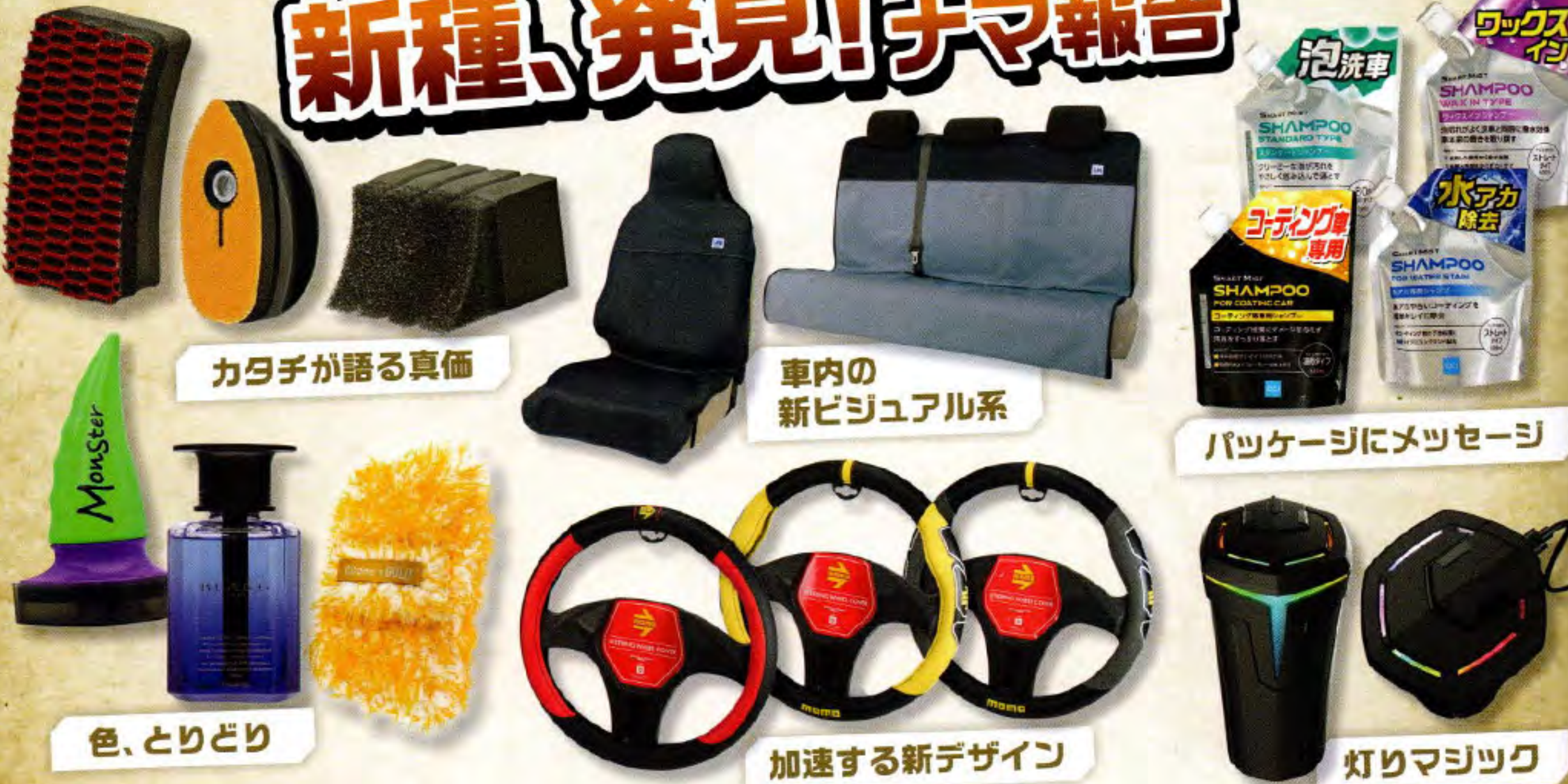
カタチが語る真価