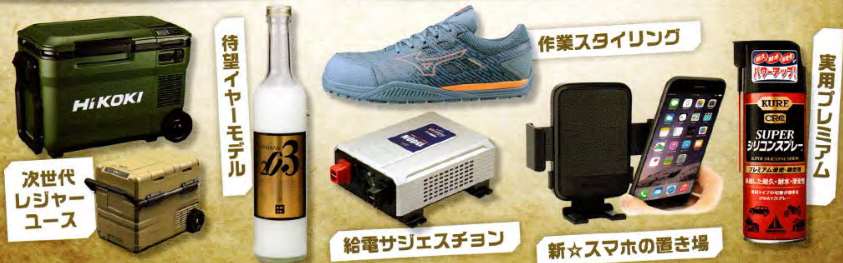
次世代レジャーユース