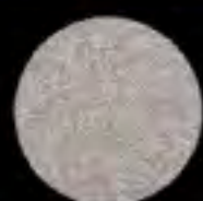
FRP製 シルバーシェル