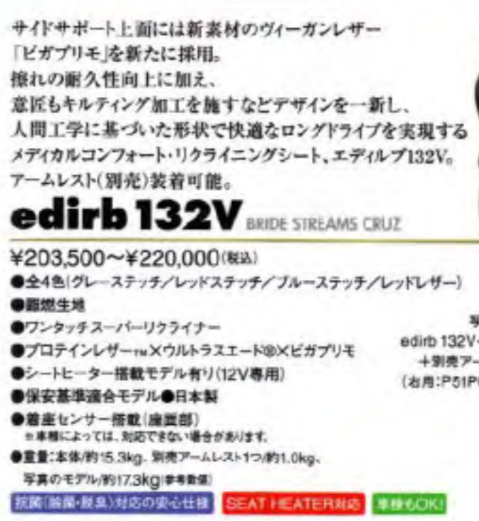
写真のモデルは、 edirb 132V・ブルーステッチ(32VCP)+ 別売アームレスト・ブルーステッチ (※別売:PS1PCZ、別売:PS2PCZ)です。

BRIDE STRADIA® STANDARD CUSHION (ロークッション) BRIDE STRADIA® LOW CUSHION ¥313,500(税込) ●スチールフレーム●スーパーアラミド製ブラックシェル ●プロテインレザー ® ×ウルトラスエード ® ×ビガプリモ ●全3色(グレーステッチ/レッドステッチ/ブルーステッチ) ●断燃生地●保安基準適合モデル●日本製 ●重量:約14.4kg(※重量) ※断燃生地(※重量)※断燃生地によっては、対応できない場合があります。 抗菌(抗菌・脱臭)対応の安心仕様 車検6OK! スーパーアラミド製ブラックシェル