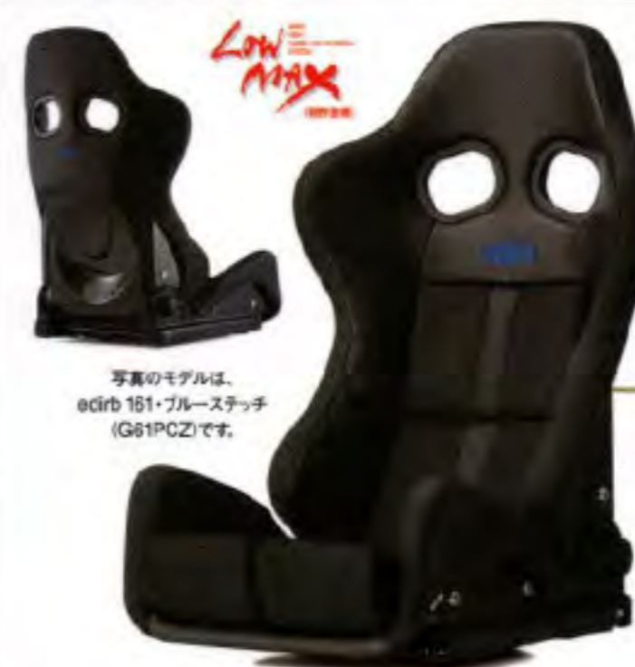
写真のモデルは、 edirb 161・グレーステッチ (G61PCZ)です。

サイドサポート上面には 新素材のワイガンレザー「ビガプリモ」を新たに採用。 擦れの耐久性向上に加え、 意匠もキルティング加工を施すなどデザインを一新し、 深いショルダーとニーサポート形状で ホールド性をさらに高めた設計の 高剛性シェル&フレームを組み合わせた リクライニング機構付きセミバケットシート、エディルプ161/162。 edirb 161 edirb 162