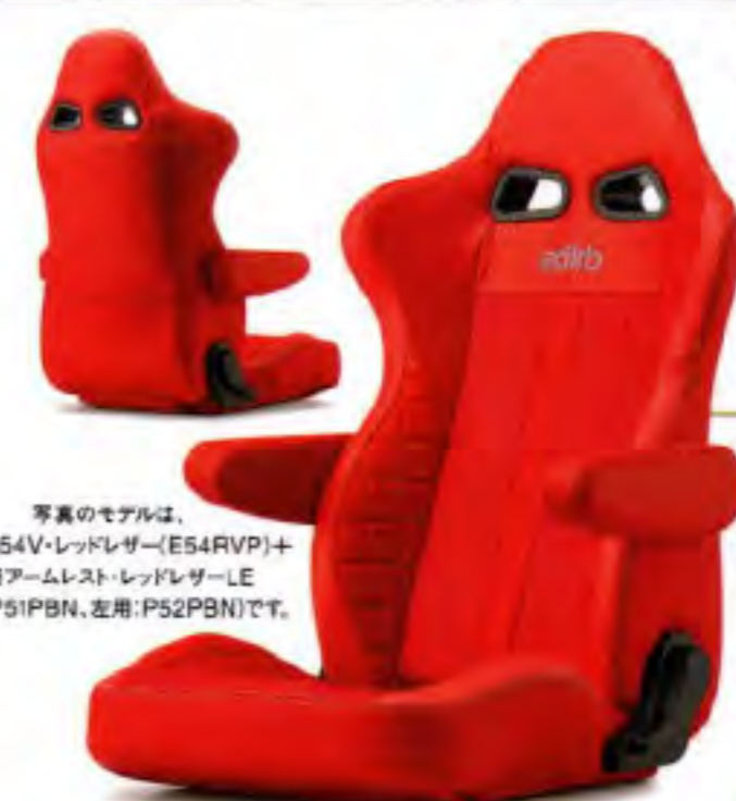
写真のモデルは、 edirb 054V・レッドレザー(E54RVP)+ 別売アームレスト・レッドレザーLE (※別売:PS1PBN、別売:PS2PBN)です。

BRIDE GIAS® STANDARD CUSHION (ロークッション) BRIDE GIAS® LOW CUSHION ¥324,500(税込) ●スチールフレーム●スーパーアラミド製ブラックシェル ●プロテインレザー ® ×ウルトラスエード ® ×ビガプリモ ●全3色(グレーステッチ/レッドステッチ/ブルーステッチ) ●断燃生地●保安基準適合モデル●日本製 ●重量:約14.4kg(※重量) ※断燃生地(※重量)※断燃生地によっては、対応できない場合があります。 抗菌(抗菌・脱臭)対応の安心仕様 車検6OK! スーパーアラミド製ブラックシェル