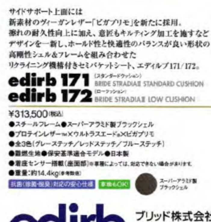
写真のモデルは、 edirb 171・グレーステッチ (G71PQZ)です。

¥203,500~¥220,000(税込) ●全4色(グレーステッチ/レッドステッチ/ブルーステッチ/レッドレザー) ●断燃生地 ●ファンタジースーパーリクライナー ●プロテインレザー ® ×ウルトラスエード ® ×ビガプリモ ●シートヒーター搭載モデル有り(12V専用) ●保安基準適合モデル●日本製 ●重量:本体約15.3kg、別売アームレスト1つ約1.0kg。 写真のモデル(約17.3kg)※重量 抗菌(抗菌・脱臭)対応の安心仕様 SEAT HEATERあり 車検6OK!