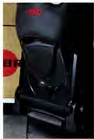
セミバケット型(161/162/171/172)の背面は、えも言われぬ複雑な形状をあえて見せている。強烈な造形ながら、えぐみなく見せられるのも高いバランス感の妙だろう。

は、従来製法よりも脱炭素化に貢献した新素材。優れた素材を積極的に取り入れ、高級感と機能性を両立させている。 シックな装いは、国産輸入車を問わず、昨今の高級車に共通する車内装のトレンドでもある。20世紀よりアフターパーツ界を牽引してきた日本拠点のメーカーだからこそ、視点は常に先へ向く。本作はその象徴とも言えそうだ。