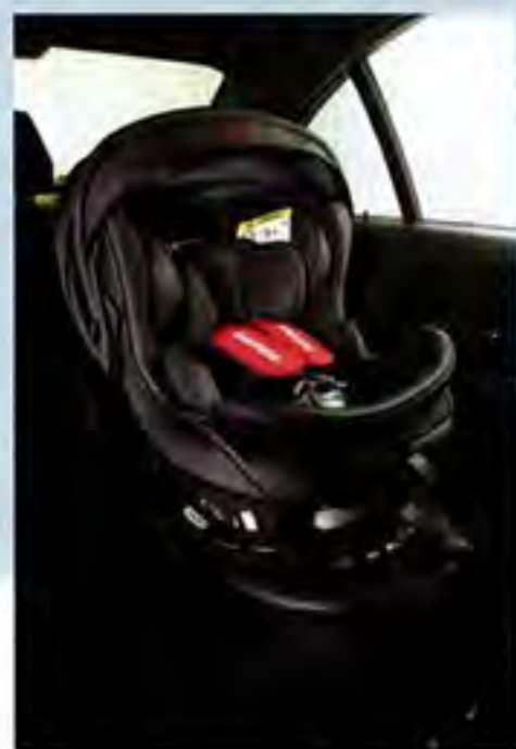
台座まで黒で統一されたことで、最近の車両内装にもスッと溶け込む。ISOFIX式は、固定後にも回転させることができ、前向きから後ろ向きへと180度の方向転換が可能だ。