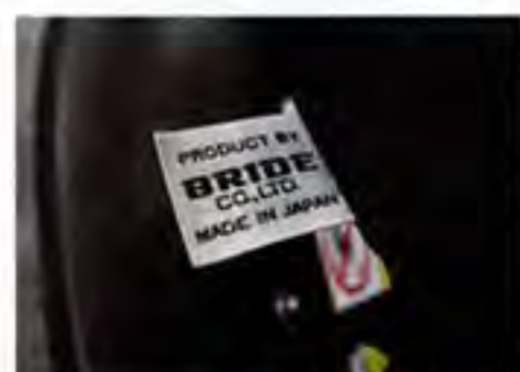
誇らしげに添えられるBRIDEのタグ。2機種のチャイルドシートは、部材調達から製造に至るまで純日本製であり、愛知製でもある。

昨年より、「0歳からのBRIDEシート」としてスタートしたチャイルドシート。専業メーカー「リーマン」とのコラボ品も、この夏、さらに広がりを見せている。 ISOFIXモデルの「コンフォルト」がリニューアルを遂げ、3点式シートベルト固定の「カローレ」とジュニアシートの「オージ」が新たに加わる