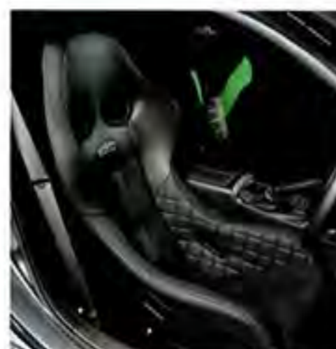
単体での主張こそ控えめなもの、車内に収めると細部のあつらえが存在感を放つ。これはエディルブシリーズ全体で共通する点。サイドサポートのキルティング処理もその一つ(新世代モデルより採用)。

あえて派手さは抑えられ、車内に置いておく象徴例といえるだろう。新世代モデルは、強度や剛性といった安全性のアップデートに加えて、一新したデザインも注目してほしいポイント。認知度を高めることに重きを置かれた初代の実績を土台に、高級志向を追求した結果、このシックなスタイルに行きついた。