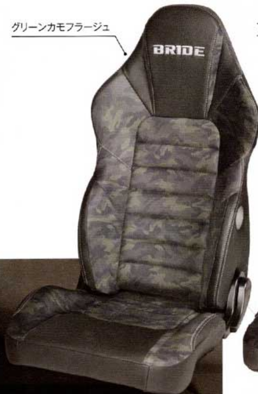
グリーンカモフラージュ