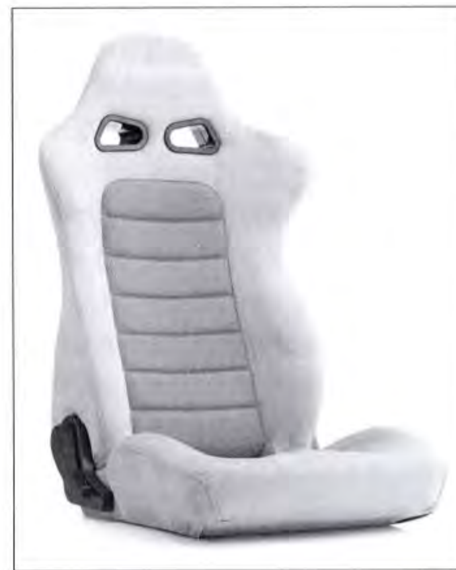
ユーロスター2 (ベージュ)

また、同社では数年前から「edirb(エディルプ)」という別ブランドを立ち上げている。同ブランドは輸入車(欧州車など)のスポーツカーやコンパクトカーを対象として、上質な素材であるスーパーアラミド製シェルとプロテインレザーを使用した落ち着いたあるハイグレードなブランドとして展開している。