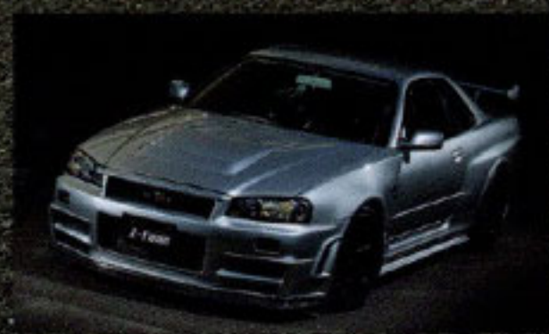
第2世代GT-Rの至宝 NISMO R34 GT-R Z-tune

2nd attack! レーシングドライバー 松田次生 愛車のS31Zで 筑波アタック!