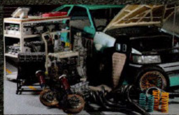
N2, TRD, グループA etc AE86お宝パーツ図鑑