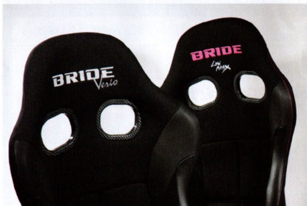
ZETA IV VERIO ZETA IV VERIA

FIA 規格取得モデルのフルバケットシート ZETA IV をベースに、身長 160 cm 以下のスリムな女性をターゲットにした ZETA IV VERIA を発売 (税込み 13 万 9700 円)。脇腹から太腿に掛けてのサイドサポートを約 30 mm 狭め、座面底部に約 15 mm の高硬度ウレタンを接着。さらに、通常のシートクッションに加え、取り外し可能な約 15 mm のウレタンを内蔵。最大約 30 mm の座面アップが図れる。男性向けの VERIO はそれらの数値こそ異なるが、同様の手法で開発中。こちらも間もなく発売となるだろう。