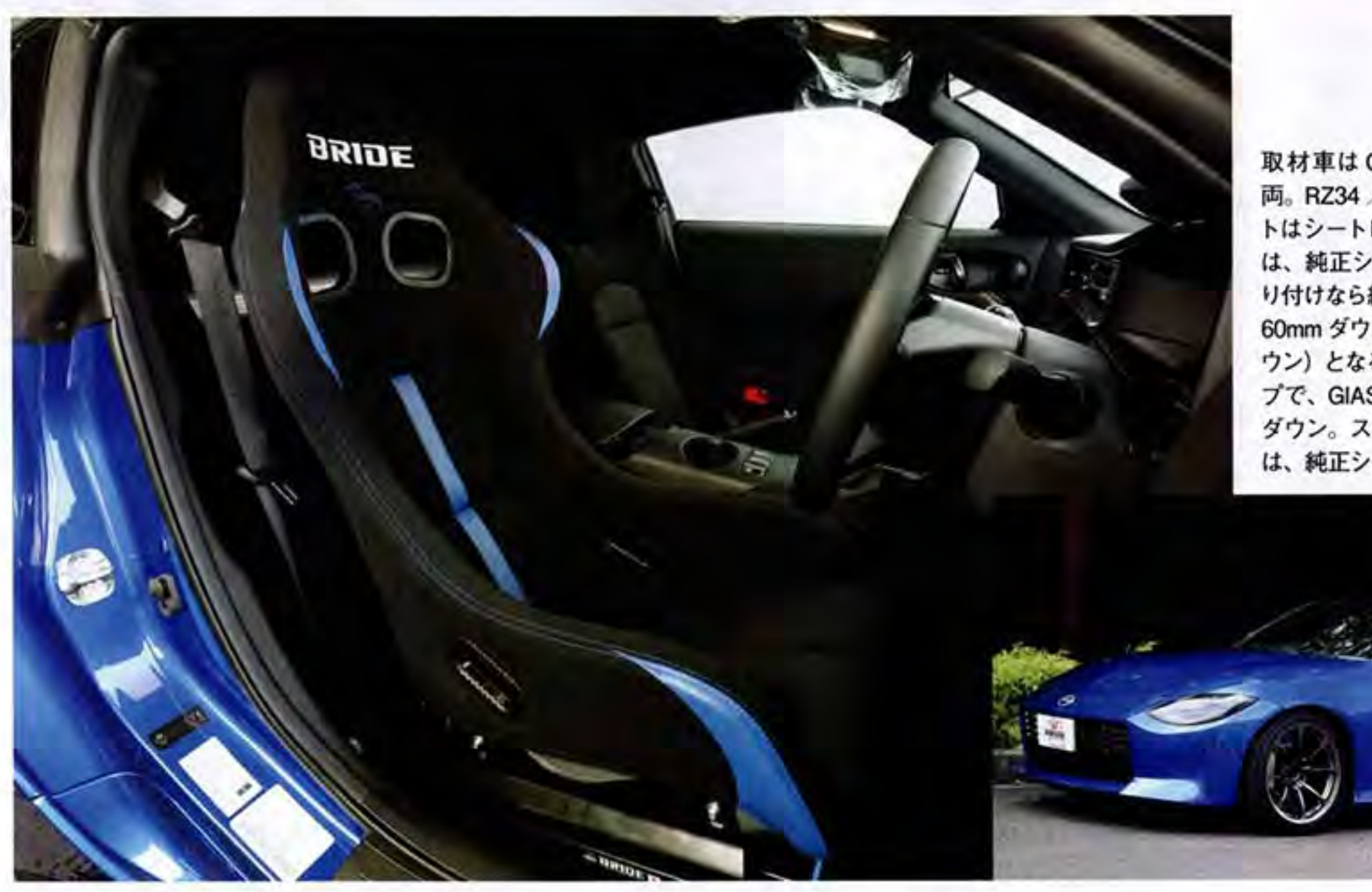
は、純正シート比 ±0mm だ

45 m ダウ 後で ほどて セン 3 スモデルの フロア ロタ タ ちばん下 が後ろ下 けではな さらに割 はな パランス その ものの ではな イプで 位 は アが後 П ±0 いる