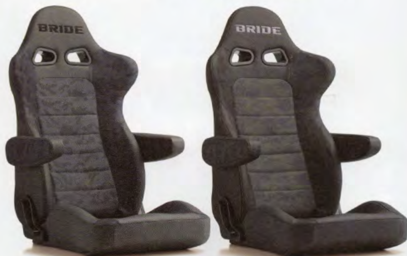
アームレストを装着したEUROGHOSTグリーン/ブルー。アームレストにもカモフラージュ柄が採用されていて一体感が生まれる