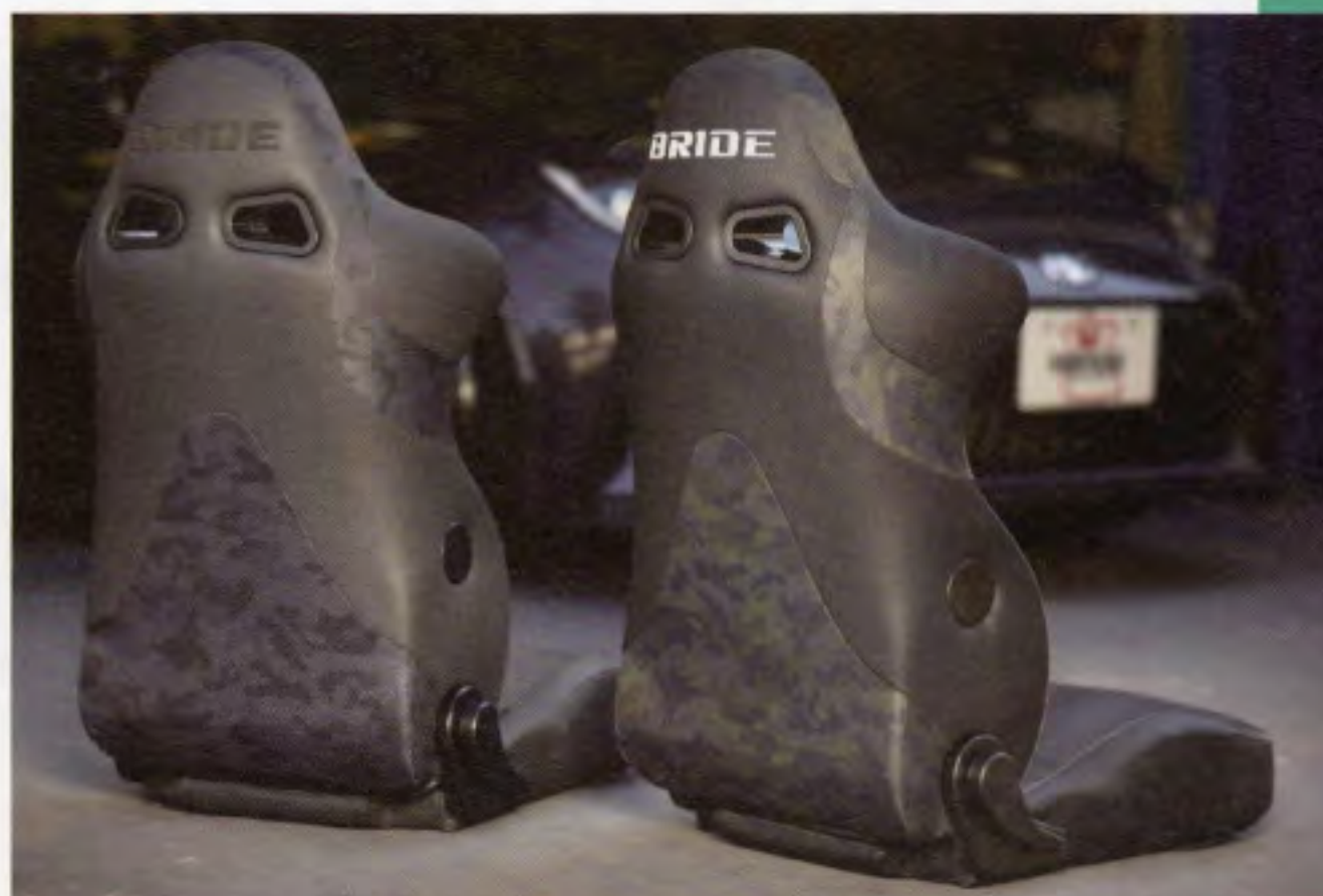
背面もカモ柄を配置。グリーンはブラックレザーとグリーンカモフラ柄のコンビ。グレーステッチで、BRIDEロゴは明るいグレー。ブルーはチャコールレザーとブルーカモフラ柄のコンビ。ブルーステッチでBRIDEロゴはブラック

なお、東京オートサロン2023では、さらにインパクトがあるシートが登場する予定だという。新たなブリッドの展開に、しばらくは注目せざるを得ないだろう。